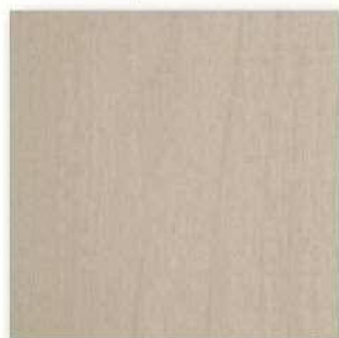
■PM-325 Matt (メイプル) ○エッジ材 : DC486H