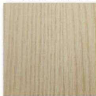
■PM-Y7 Super Matt (ソールズベリーオーク) ○エッジ材 : DC7L82