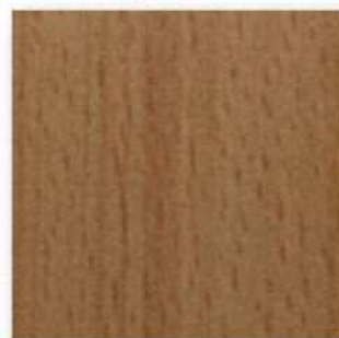
■PM-205 Matt (ビーチ) ○エッジ材 : DCL651