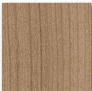
■PM-67B WG (チェリーカプチーノ) ○エッジ材 : DC533U