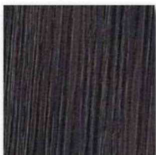
■PM-AT9 Matt (シェフィールドオーク) ○エッジ材 : DC5142