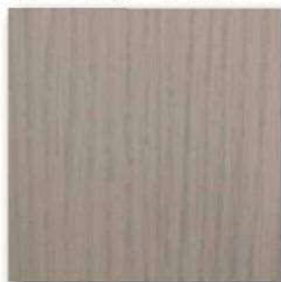
■PM-Y6 Super Matt (マラガチェリーフラット) ○エッジ材 : DC7L83