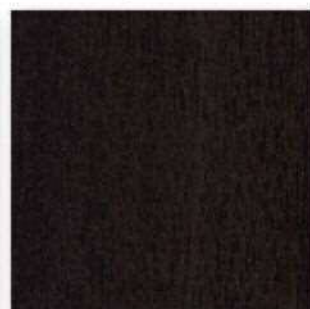
■PM-AG3 WG (モディオーク) ○エッジ材 : DC4L38