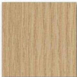
■PM-69A Matt (オーク) ○エッジ材 : DC648P