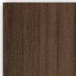
■PM-AP5 Super Matt (シャンパンウォールナット) ○エッジ材 : DC1058