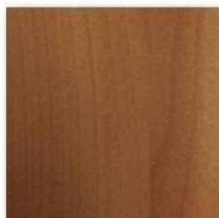
■PM-0J6 Matt (チェリー) ○エッジ材 : DC8L60