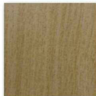
■PM-0125 Matt (ナチュラルオーク) ○エッジ材 : DC6L94